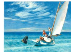
Lame de fond Edward Hopper 1939