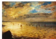
La mer vue des hauteurs de Dieppe Eugène Delacroix 1852