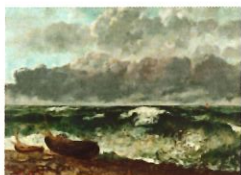
La mer orageuse dit aussi la vague Gustave Courbet 1870