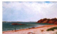
Vue de la plage à Beverley Massachusetts John Frederick Kensett 1860