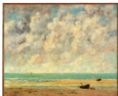
La mer calme Gustave Courbet 1869