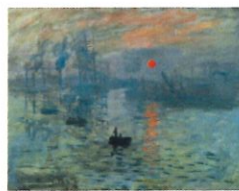
Impression soleil levant Claude Monet 1872