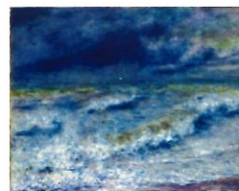
La vague Auguste Renoir 1879