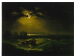
Pêcheurs en mer William Turner 1796

Les enfants découvrent les différentes oeuvres et sont invités à les décrire, à analyser les différences et ressemblances et à exprimer les émotions qu'ils ressentent.