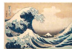
La grande vague de Kanagawa Katsushika Hokusai 1831