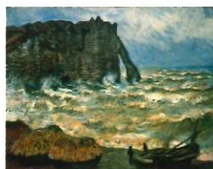
Mer agitée à Etretat Claude Monet 1883